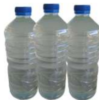
Gambar 5 Destilat moke

Gambar 4 menunjukkan proses memasak moke dengan cara memanaskan moke putih pada tungku api dan menggunakan wadah drum sebagai tempat penampungan. Hasilnya dialiri melalui bambu dan kemudian ditampung pada wadah. Produksi moke ini masih menggunakan cara tradisional dengan peralatan sederhana. Rangkaian bambu yang dirancang menyerupai rangkaian peralatan destilasi sederhana. Destilat umumnya ditampung pada wadah (kumbang) yang kemudian dikemas dalam botol (Gambar 5).