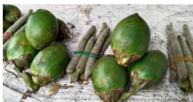
Gambar 2. Sirih & Pinang

Tradisi menyirih adalah salah satu bentuk kearifan lokal dan warisan budaya dalam kehidupan masyarakat Sikka. Buah pinang ( wu'a ) dan sirih ( ta'a ) banyak ditanam di kebun oleh masyarakat di daerah perkampungan kabupaten Sikka. Pinang dan sirih pun dapat diperoleh pada pasar-pasar tradisional. Kegiatan menyirih dilakukan oleh orang tua maupun orang muda baik dalam kehidupan sehari-hari maupun dalam upacara adat seperti pernikahan yang juga menjadi tradisi secara turun temurun. Selain itu, pinang dan sirih sebagai simbol penerimaan dan penghormatan kepada tamu.