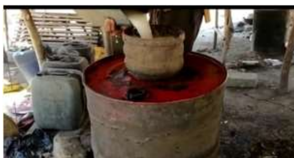
Gambar 4 Proses memasak moke

Minuman alkohol masyarakat Sikka dikenal dengan istilah moke . Minuman ini diperoleh dari air hasil irisan tandan bunga lontar yang banyak terdapat di daerah Kabupaten Sikka. Hasil irisan ditampung dan menghasilkan moke putih ( tua bura ) yang berasa manis. Tempat penampungan moke putih dapat berupa wadah yang terbuat dari bahan plastik maupun wadah tradisional yang terbuat dari bambu. Jika ditambahkan serpihan serabut kelapa pada moke putih yang ditampung pada bambu, maka rasa moke putih menjadi masam. Moke putih yang masam ini lama kelamaan menjadi cuka bila dibiarkan di tempat terbuka.