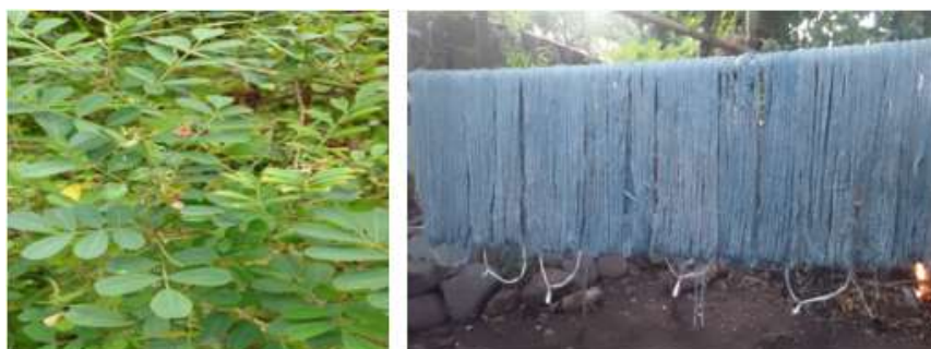
Gambar 1. Tanaman Nila & Warna Hasil Perendaman

Bahan-bahan alam yang digunakan, antara lain: tanaman nila, kunyit, kulit pohon dan daun kakao, daun-daunan berklorofil yang masing-masing menghasilkan warna biru, kuning, coklat dan hijau. Bahan-bahan alam tersebut diperoleh dari alam bebas yang berada di daerah Sikka. Berikut adalah potret tanaman Nila yang menghasilkan warna biru khas sebagai warna terbaik dari tenun Sikka, Flores, NTT.