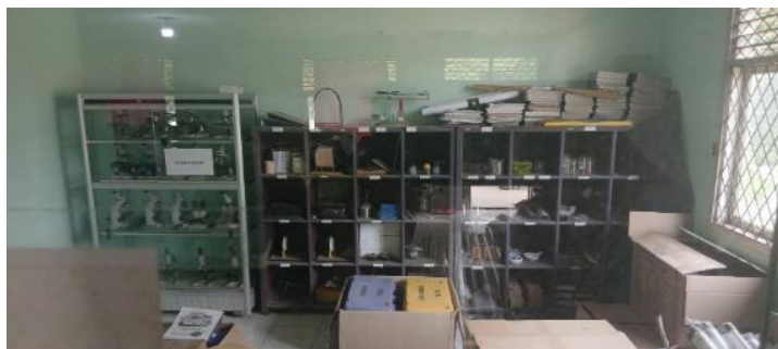
Gambar 1. Kondisi laboratorium IPA

Berdasarkan hasil observasi dan wawancara yang dilakukan di SMP Negeri 1 Bathin Solapan, ditemukan bahwa sistem pencatatan inventaris laboratorium IPA masih dilakukan secara manual, baik menggunakan buku inventaris fisik maupun format digital sederhana seperti Microsoft Excel yang belum terintegrasi. Kondisi ini sejalan dengan temuan Evana et al. (2021) yang menyatakan bahwa banyak laboratorium sekolah masih berstatus sebagai fasilitas pelengkap tanpa sistem pengarsipan yang memadai. Hasil wawancara dengan Bapak Bistok H. Pasaribu, S.Pd., guru IPA di SMP Negeri 1 Bathin Solapan, mengungkapkan adanya kesenjangan signifikan antara kondisi ideal dengan realitas tata kelola laboratorium. Beliau menyatakan bahwa proses pencatatan yang ada saat ini menyebabkan data mudah hilang, tingkat akurasi rendah, dan sulit diperbarui secara real-time . Pendataan ulang inventaris pun tidak dilakukan secara rutin, melainkan hanya pada saat dibutuhkan, seperti menjelang proses akreditasi. Kondisi tersebut dapat diamati pada Gambar 1.