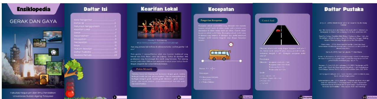
Gambar 2. Rancangan Isi Ensiklopedia Berbasis PBL Pembelajaran IPA Kelas VII

Tahap perancangan memiliki tujuan untuk menyusun Ensiklopedia yang disesuaikan dengan materi IPA untuk peserta didik kelas 7 semester ganjil, dari hasil analisis yang sudah dilaksanakan sebelumnya, pada tahap ini rancangan Ensiklopedia akan mengintegrasikan sintaks Problem Based Learning (PBL) dan indikator-indikator yang berkaitan dengan kemampuan berpikir kritis. Dengan demikian, Ensiklopedia berbasis Problem Based Learning (PBL) dengan model sintaks PBL yang berisi rancangan seperti Capaian Pembelajaran, Tujuan Pembelajaran, sintaks PBL serta materi yang sudah disesuaikan dengan kemampuan peserta didik. Ensiklopedia berbasis PBL ini dikembangkan didesain dengan menggunakan software Canva . Rancangan LKPD berbasis Problem Based Learning (PBL) dapat dilihat pada Gambar 2.