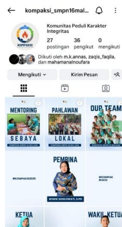
Gambar 4. Instagram Kompaksi

Tahap ketiga, dilakukan pembentukan identitas digital sebagai wujud eksistensi dan media komunikasi publik Kompaksi. Akun Instagram @kompaksi_smpn16malang dibuat sebagai sarana dokumentasi, publikasi kegiatan, serta media kampanye sosial dan lingkungan. Melalui platform ini, pesan-pesan edukatif dan inspiratif tentang kepedulian sosial dan lingkungan dapat disebarluaskan secara luas, baik di dalam lingkungan sekolah maupun ke masyarakat umum.