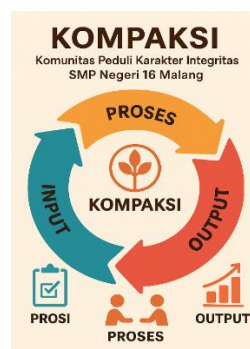
Gambar 5. Prototipe Model Kompaksi

Output. Tahap output menunjukkan hasil konkret dari pelaksanaan program Kompaksi. Secara individual, siswa menunjukkan peningkatan dalam hal kepemimpinan, tanggung jawab, kerja sama, dan kepedulian sosial-lingkungan setelah terlibat dalam pelaksanaan program Kompaksi. Secara kelembagaan, sekolah mengalami penguatan budaya karakter yang ditandai dengan peningkatan partisipasi siswa dalam kegiatan sosial serta terbentuknya ekosistem pembelajaran karakter yang lebih kolaboratif dan berkelanjutan. Hal ini sejalan dengan Hairul et al., (2022) yang menjelaskan bahwa pembelajaran berbasis komunitas dapat memperkuat kultur sekolah melalui partisipasi kolektif, kolaborasi, serta keteladanan antar warga sekolah dalam menjalankan praksis nilai karakter. Di sisi lain, masyarakat sekitar juga turut merasakan dampak positif dari kegiatan ini melalui keterlibatan siswa dalam kegiatan sosial dan proyek lingkungan berbasis komunitas.