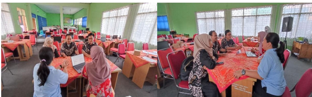
Gambar 2. FGD Bersama Guru PJ Duta Karakter SMP Negeri 16 Malang

Proyek sosial berbasis nilai karakter. Proyek sosial ini dirancang sebagai wahana penerapan nilai integritas melalui aksi nyata yang memberikan dampak positif bagi lingkungan sekolah maupun masyarakat. Strategi ini didasarkan pada pemahaman bahwa pembentukan karakter tidak cukup melalui pembelajaran konseptual, tetapi harus diperkuat dengan pengalaman sosial dan kontribusi nyata terhadap komunitas (Ramdani et al., 2025). Dalam rangka membentuk komunitas peduli karakter integritas tersebut, siswa yang sebelumnya menjadi duta karakter dijadikan inti komunitas. Komunitas ini kemudian menyusun dan melaksanakan lima proyek sosial, yaitu: 1) Proyek Bank Sampah Berintegritas (mengasah kejujuran dan tanggung jawab pengelolaan sampah); 2) Proyek Solidaritas (menumbuhkan rasa percaya dan gotong royong); 3) Proyek Aksi Adil (melatih keberanian menyuarakan keadilan di lingkungan sekolah); 4) Proyek Pahlawan Lokal (menggali nilai-nilai hormat dari tokoh inspiratif di sekitar siswa); 5) Proyek Peduli Lingkungan (mendorong tanggung jawab terhadap kelestarian lingkungan).