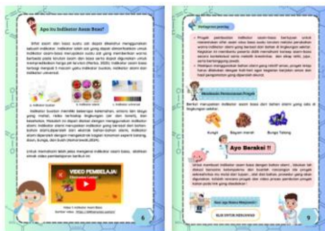
Gambar 2. Hasil Validasi Materi

Gambar hasil validasi materi sesudah melalui tahap revisi disajikan pada gambar berikut