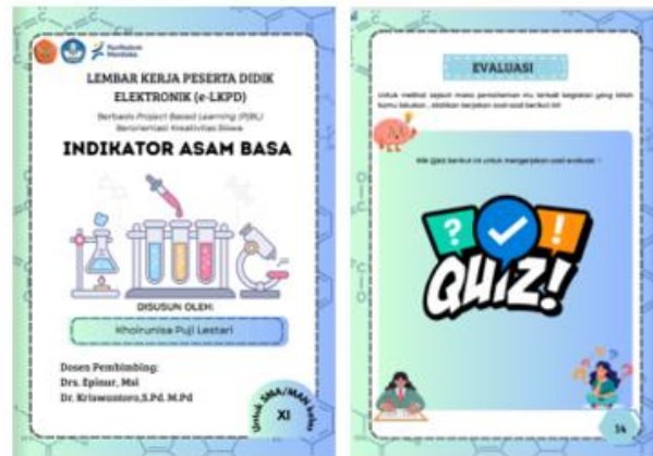
Gambar 3. Hasil Validasi Media

Gambar hasil validasi media sesudah melalui tahap revisi disajikan pada gambar berikut