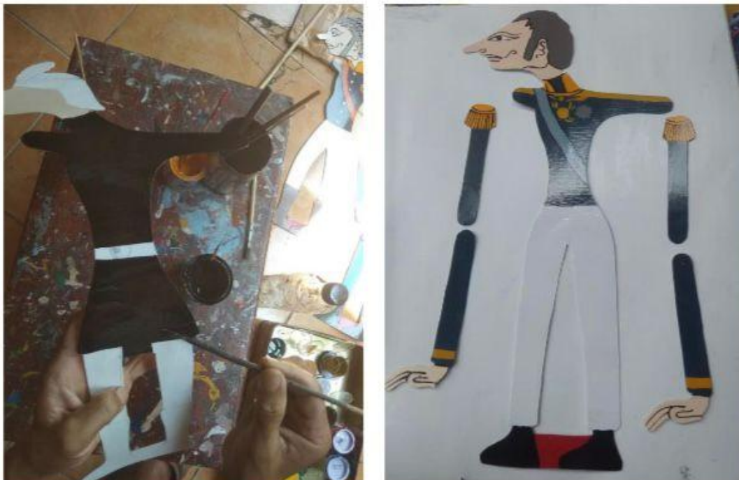
Gambar 2. Pewarnaan Wayang dan Pengeringan Wayang