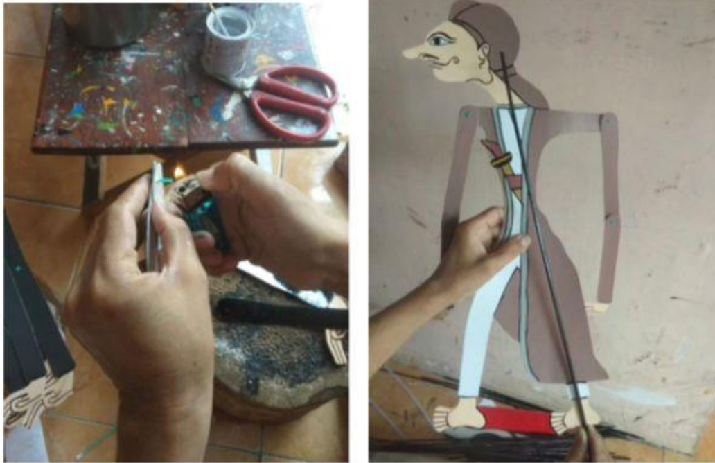
Gambar 3. Perakitan Wayang dan Pemasangan Gampit