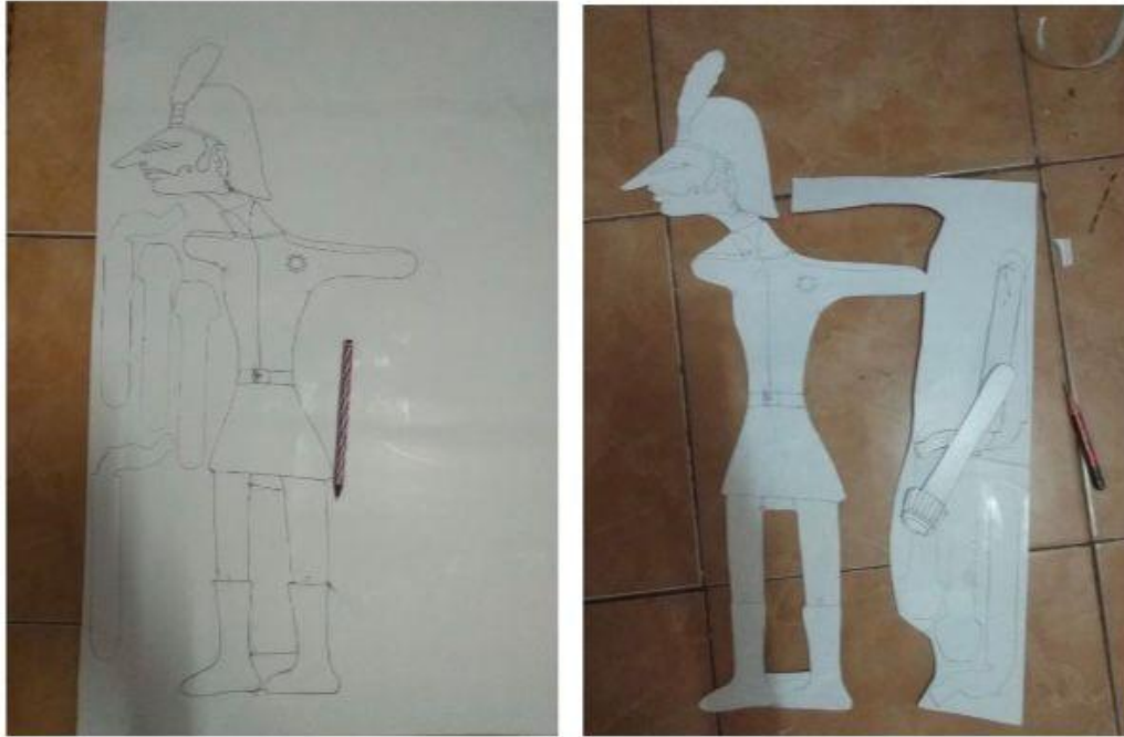
Gambar 1. Pembuatan sketsa dan pemotongan sketsa Wayang

Pada tahapan ini dilakukan pembuatan Wayang Kreasi. Kegiatan pembuatan media ini dibagi menjadi beberapa tahapan hal ini dapat dilihat pada gambar 1, gambar 2, gambar 3, dan gambar 4 dibawah ini.