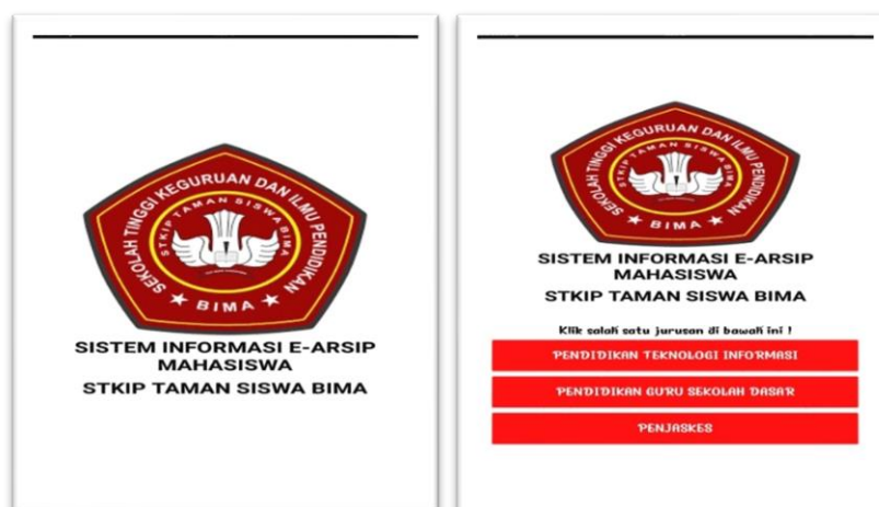
Gambar 3. Hasil Revisi Tampilan Awal sistem informasi e-arsip , Penambahan Menu e-arsip skripsi

Berdasarkan revisi yang telah dilakukan dari dua poin tersebut dapat dilihat pada gambar 3.